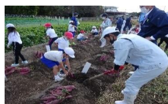
グリーンライフ(交流学习)