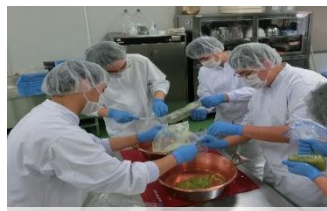
食品製造(キウイジャム研究)