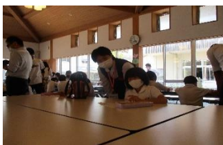
フードデザイン(給食試食会)