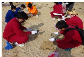
鳴き砂ボランティア

昨年度、1年次から3年次の14名の生徒が地域貢献ボランティアに参加しました。参加にあたっては、阿武町教育委員会など、地元の多くの方に協力いただきました。また、本校近郊にある清ヶ浜は鳴き砂の浜として有名です。毎年、全校をあげて清ヶ浜の清掃ボランティアに取り組み、地域の方々ともに地域の環境資源を守る活動を積極的に行っています。